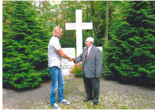
Gedenkkreuz in Slesin