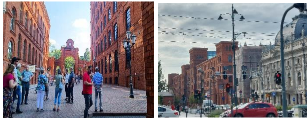
Lodz – ehemalige Textil-Industriestadt