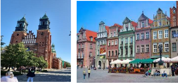
POSEN – Dominsel – Alter Markt