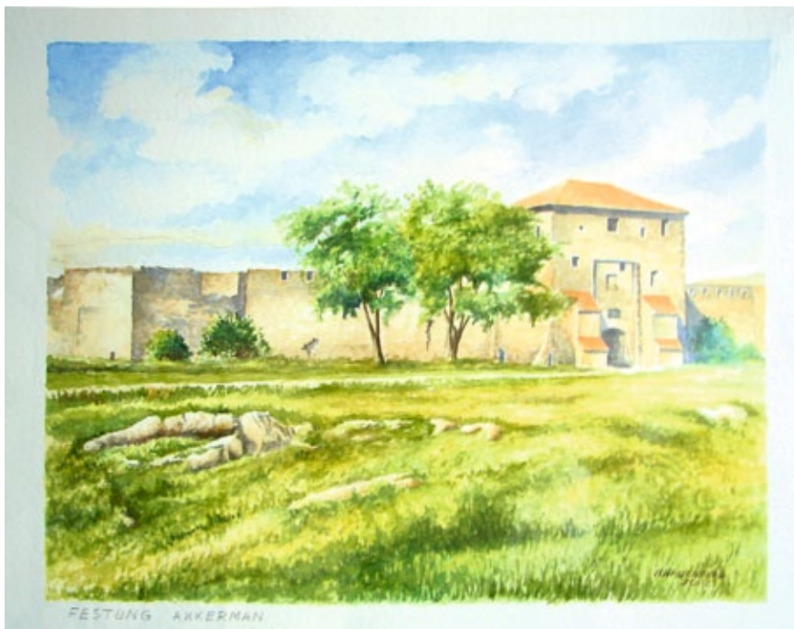
Festung Akkerman (2002)