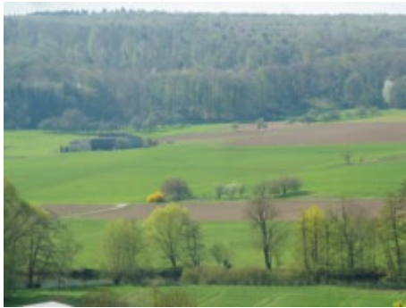
Blick von der Balkon-Terrasse über die Enz

Augen unsere 65 ha ab zu messen, drüben über der Enz, und beginne zu träumen.