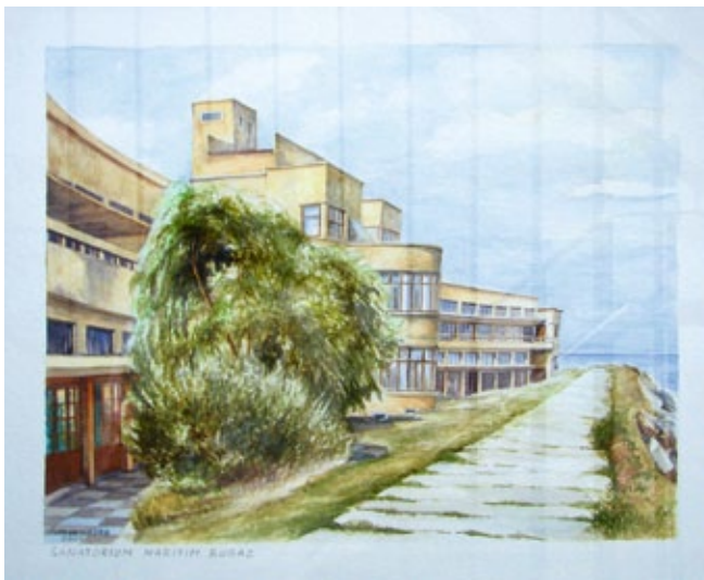
Sanatorium Maritim Bugaz (2001)