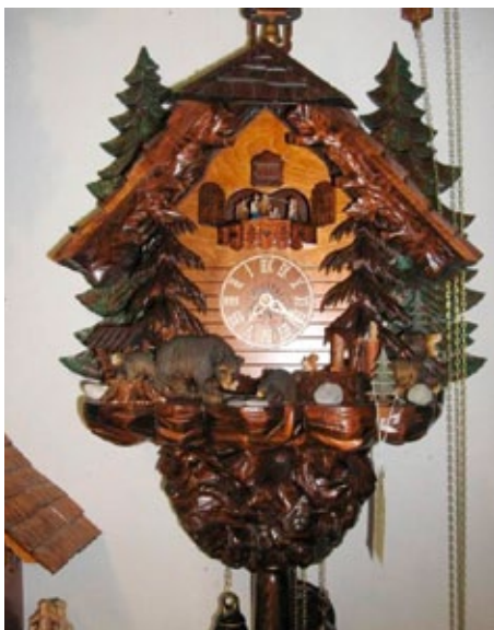
...ertönt der Ruf einer echten Schwarzwälder Kuckucksuhr