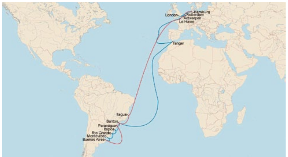
Reiserouten der bessarabischen Einwanderer

Weiter erzählt er, dass Porto Feliz - glücklicher Hafen - von deutschen Siedlern gegründet und so genannt wurde. Ein idyllischer Ort, in Santa Catherina am Rio Uruguay gelegen. Dahinter zeichnen sich Berge von Rio Grande do Sul ab. Die ersten Siedler kamen aus Neu Württemberg,