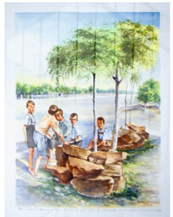
Bessarabien: Buben in ihrer Freizeit auf der Dorfstraße in Friedenstal 1940 (2005)