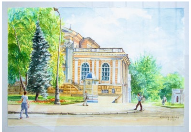
Ohne Titel (2001)