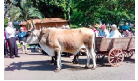
Festumzug zur 500-Jahr-Feier der Reformation in Mondai (ehemals Porto Feliz)