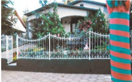
Aus diesem brasilianischen Haus...

„Wir freuen uns auch alle hier, täglich den Kuckuck zu hören“, warf eine Frau ein, die vom Nachbarhaus herüber kam. „Und Sie“, ich wandte mich an die Nachbarin, „klingen irgendwie pfälzisch.“ „Meine Vorfahren kamen aus dem Hunsrück,