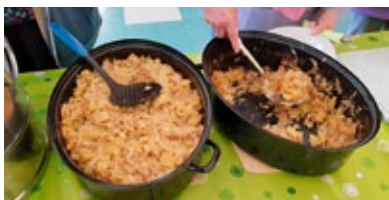
Es gab köstliches, hausgemachtes bessarabisches Essen