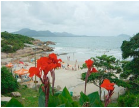
Blick aufs Meer: Porto Feliz erhielt seinen Namen von den deutschen Gründern

genauer gesagt von Idar-Oberstein im Hunsrück.“