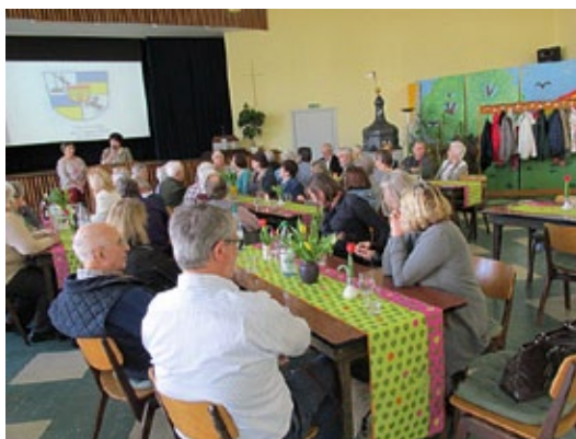
Die Gäste sahen Präsentationen vom früheren und vom heutigen Klöstitz