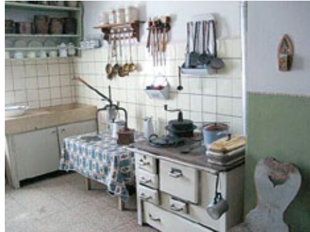
Schwäbische Küche in Brasilien