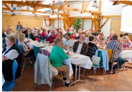
Teilnehmer des Begegnungstages