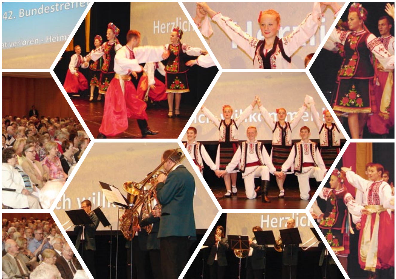
Das 42. Bundestreffen war wunderschön – Herzliche Einladung zum 43. Bundestreffen am 24. Juni 2018.