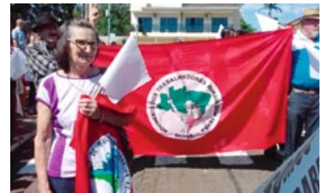
Hunderte Bürger zogen in Volkstrachten oder mit Plakaten, von hunderten neugieriger Besucher bestaunt, vom Hafen kommend durch die Stadt.