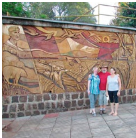
Reliefwand zur Erinnerung der Besiedlung von Porto Feliz, Alma und der Autor. Das kunstvoll gearbeitet Relief präsentiert die einzelnen Etappen.