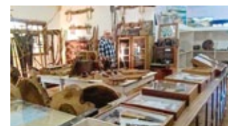
Historisches Museum im Haus der Kultur, Municipat Mondai