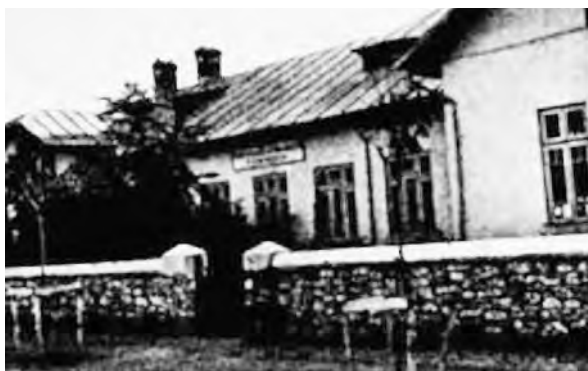
Deutsch-evangelische Volksschule in Kobadin

Staatsschule hergestellt und zum anderen auf eine neutrale und wohlwollende Haltung der staatlichen Aufsichtsbehörde bei der bevorstehenden Jahresschlussprüfung hingearbeitet. Laut staatlichem Volksschulgesetz musste eine nicht-staatliche Schule 3 Jahre hintereinander eine Abschlussprüfung in allen Klassen und allen Gegenständen in rumänischer Sprache mit Erfolg ablegen, bevor sie das Öffentlichkeitsrecht erhielt. Mit Dankbarkeit über die Leistungen unserer Kinder und großer Freude über den Erfolg, der uns beschieden war, konnten wir schon im ersten Jahr die Zuerkennung des Öffentlichkeitsrechtes für unsere Schule der Gemeinde und unserem Bezirkskonsistorium in Bukarest bzw. dem Landesschulrat in Hermannstadt melden.