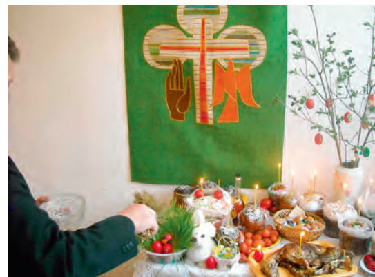
Fotos von der Ev.-lutherischen Gemeinde St. Nikolai in Kischinew (s. auch Bericht in der Januararausgabe, S. 16)