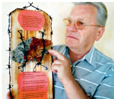
Dieses Bildnis ist allen Diktaturen gewidmet und wurde von mir erstellt