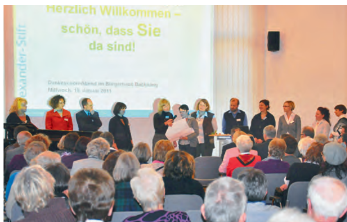
Vollbesetzte Reihen im Backnanger Bürgerhaus

Dankeschön-Fest des Alexander-Stifts für Ehrenamtliche