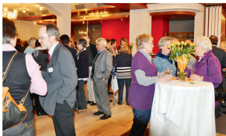
Regel Austausch bei den „Stehstisch-Gesprächen“