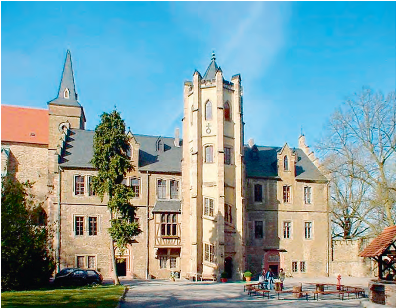
Schloss Mansfeld, ein bevorzugter Treffpunkt in Sachsen-Anhalt