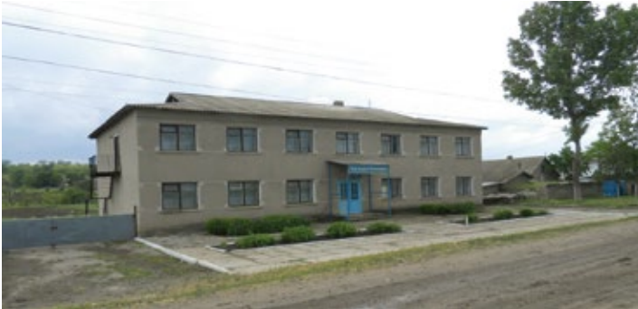
Die neue Schule 2010