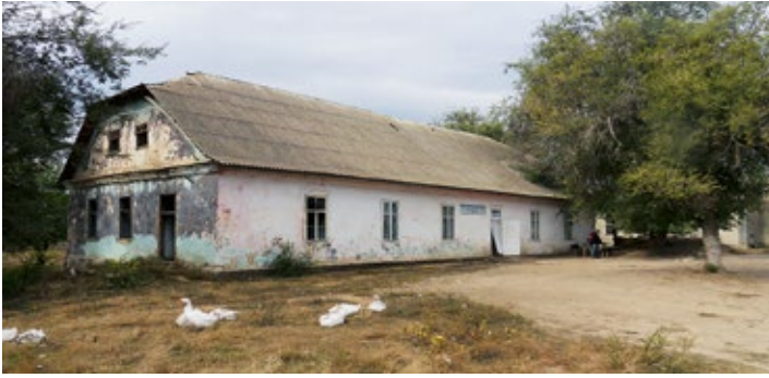
Schulgebäude 2017, jetzt Einkaufsladen