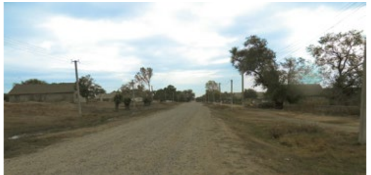
Dorfstraße vom Oberdorf in Richtung Kirche 2017