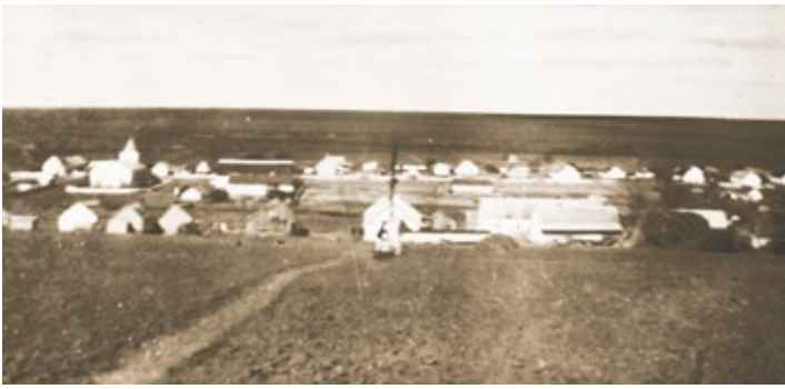
Dorfansicht aus den 1930er Jahren