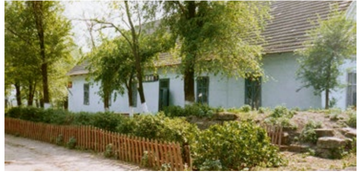
Altes Schulgebäude 1989