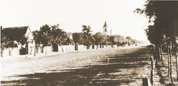
Dorfstraße 1930er Jahre