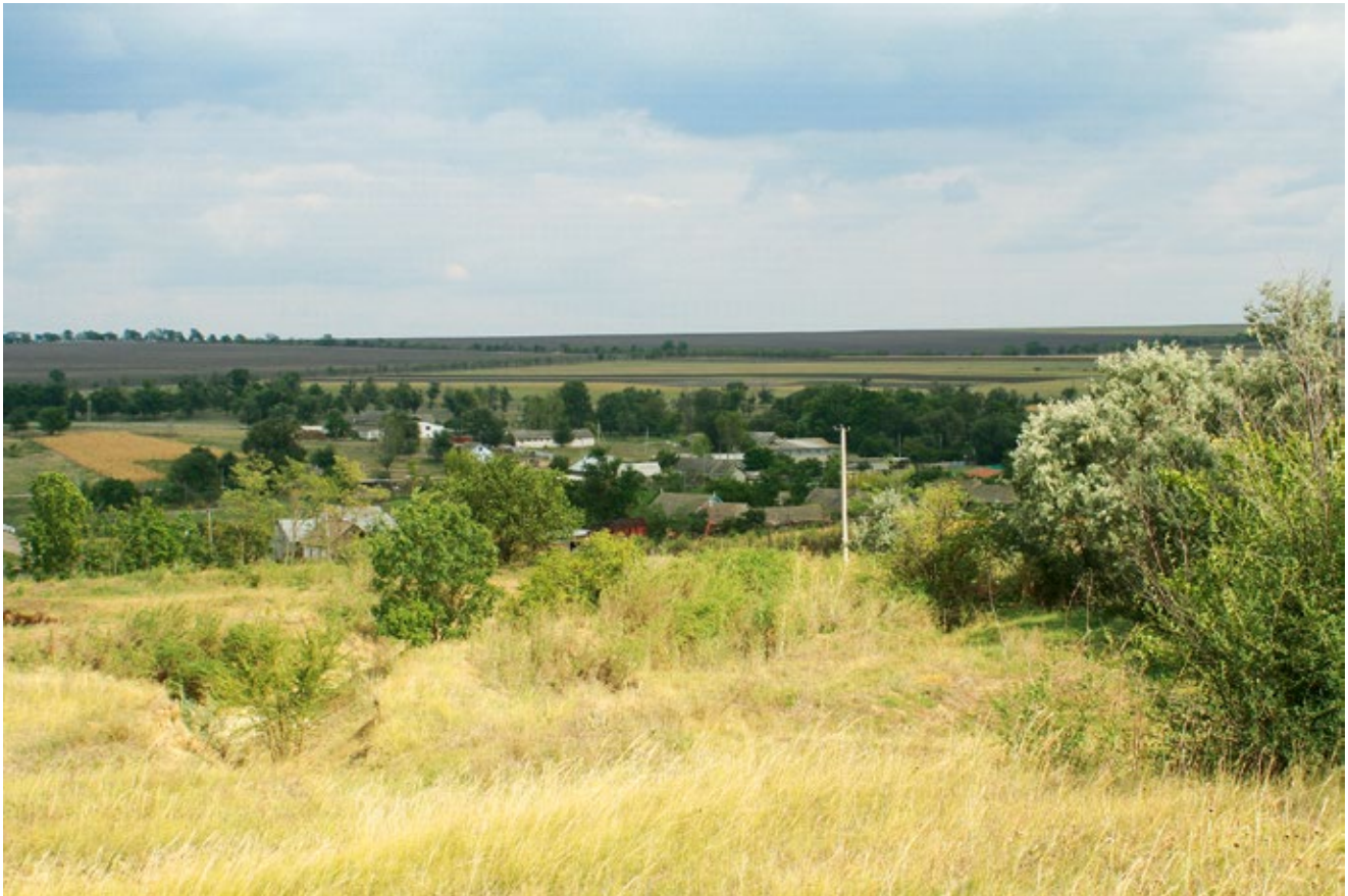
In diesem Jahr ist das 200-jährige Gründungsjubiläum von Katzbach. Eine Serie im Mitteilungsblatt feiert das Ereignis. Bild: Blick vom Friedhof auf Katzbach im Jahr 2009. Zum Bericht auf Seite 3.