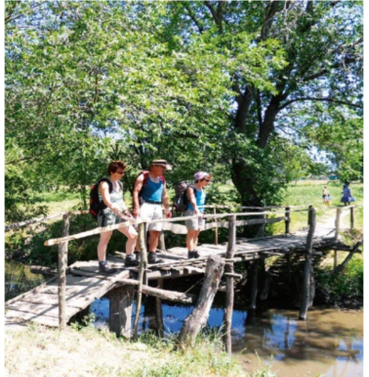
Der alte Schulweg über den Bach Aliaga im Jahr 2011

Es lief also auch in Katzbach alles nach „guter alter Sitte“ ab. „Wer sich in der Gemeinschaft nicht ordentlich verhielt