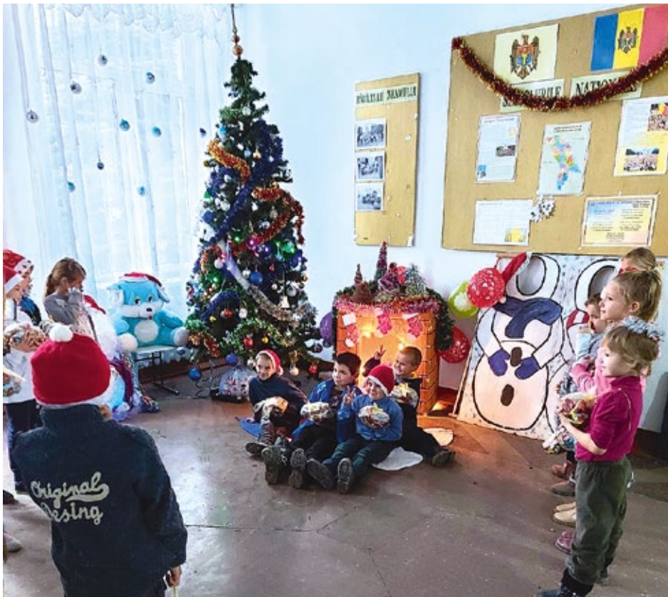
Eine Weihnachtsüberraschung für die Kinder in Ciobanovka

Noch vor Weihnachten schickten die Schulkinder Bilder des Dankes nach Walle und in die USA.