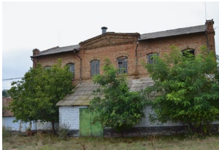
Die Ölmühle in Fürstenfeld war im Jahr 2011 noch in Betrieb. Im August 2013 fanden wir sie verlassen vor.

Fürstenfeld II ist der Geburtsort meiner Mutter. „Die Mühle ist immer noch in Betrieb“, wurde mir erzählt, als ich mich im Jahr 2011 als neu gewählter Beisitzer im Vorstand des Bessarabiendeutschen Vereins stellte. Die Mühle in Fürstenfeld war also etwas Besonderes, und bei meiner ersten Bessarabienreise im August 2013 suchte ich sie auf, gemeinsam mit meinem Mann und dem von Herrn Kelm vermittelten Fahrer, der die Lage zwischen den Dörfern Fürstenfeld I und II kannte. Das Geburtshaus meiner Mutter stand nicht mehr, und so hatten wir Zeit für die