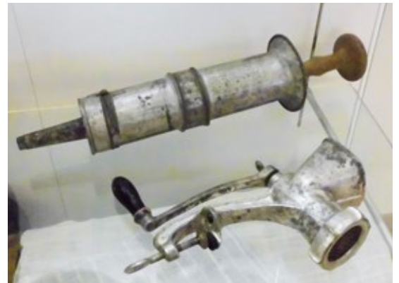
Wurstspritze und Fleischwolf

Im Bildkalender 1989 schrieb Christian Fieß einen informativen Text zum Hausschlachten in Bessarabien: