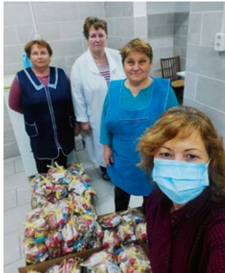
Geschenketüten-Packen in Corona-Zeiten