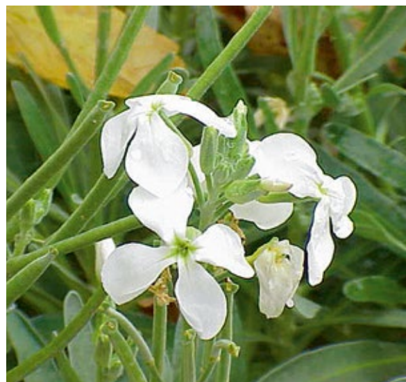
Levkojen: Der Duft der Heimat?