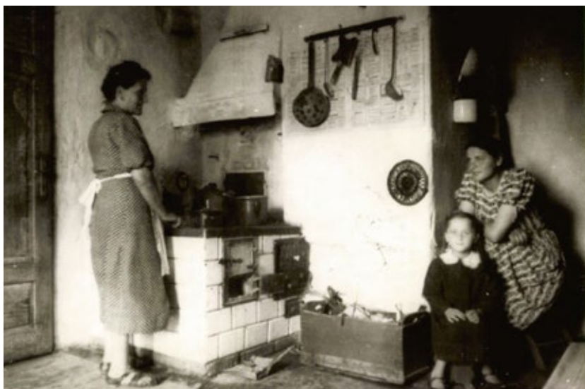
Die bessarabische Küche hält allerlei köstliche Düfte bereit. Hier in der Küche eines bessarabischen Bauernhauses.