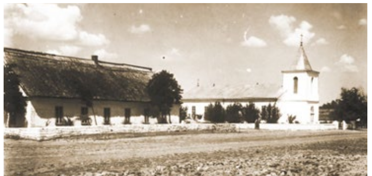
Schule mit Kirche in deutscher Zeit