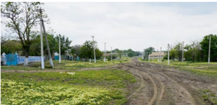
Dorfstraße vom Oberdorf in Richtung Kirche 2010