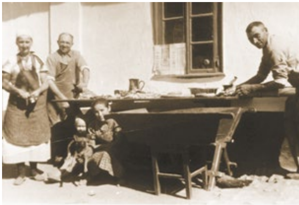
Beim Wurstmachen in Bessarabien

Aber auch in Bessarabien war der Schlachttag etwas nicht Alltägliches. Geschlachtet wurde immer in der kalten Jahreszeit, denn dann konnten die Mengen an Fleisch, Schinken und Wurst, die bei einer „Schweineschlacht“ in größeren Mengen anfielen, sofern sie nicht geräuchert oder gepökelt wurden, länger aufbewahrt werden.