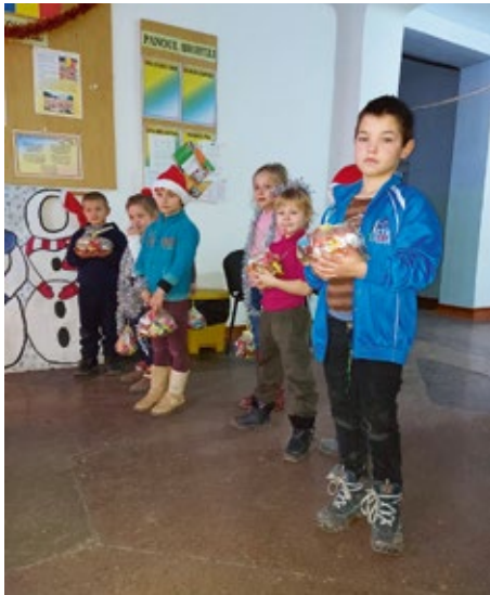
Die süßen Tüten sind etwas ganz Besonderes